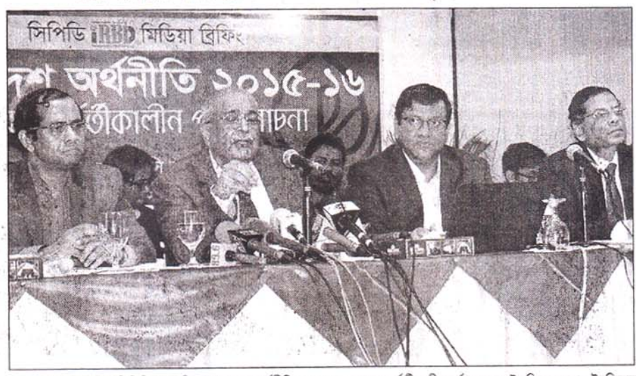
ব্র্যাক সেন্টারে গতকাল সিপিডি আয়োজিত বাংলাদেশ অর্থনীতি ২০১৫-১৬ প্রথম অন্তর্বতীকালীন পর্যালোচনায় উপস্থিত বকারা –ইনকিলাব

সিডিপির গবেষণা প্রতিবেদন প্রকাশ করে বিশিষ্ট এ অর্থনীতিবিদ বলেন, চলতি অর্থবছরে বড় ধরনের রাজস্ব ঘাটতি হবে; যা প্রায় ৪০ হাজার কোটি টাকার মতো হতে পারে। আর এ পুঃ ২ কঃ ১