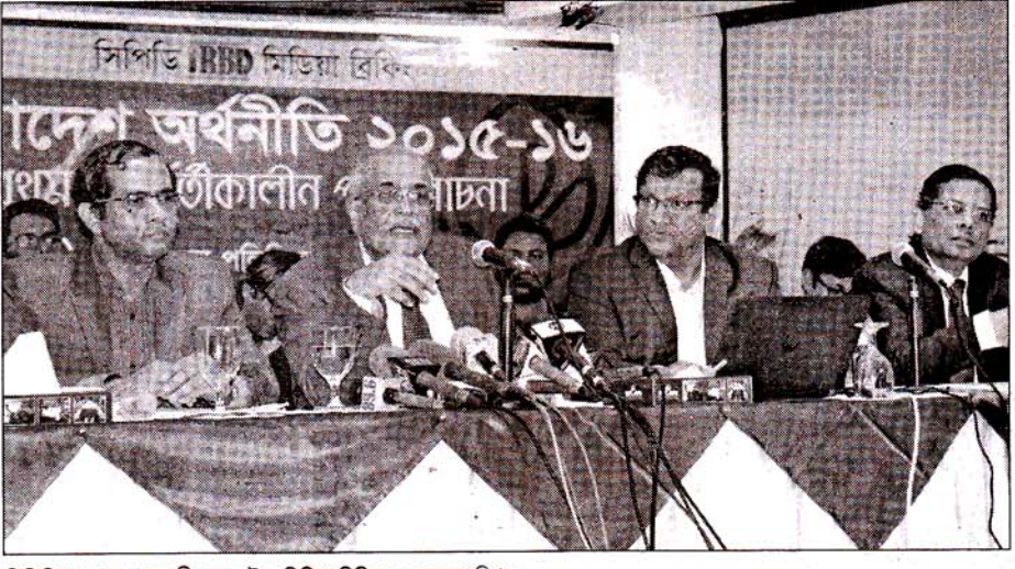
সিপিডি গতকাল রাজধানীর ব্র্যাক ইনে মিডিয়া ব্রিফিং করে 🖩 নয়া দিগন্ত

বেসরকারি গবেষণা প্রতিষ্ঠান সেন্টার ফর পলিসি ডায়ালগ (সিপিডি) জ্বালানি তেলের দাম কমানোর সুপারিশ করেছে। বিশেষ করে ডিজেল, কেরোসিন ও ফার্নেস অয়েলের দাম বেশি করে কমানো উচিত বলে মতপ্রকাশ করেছে সিপিডি। একই সাথে প্রতিষ্ঠানটি বলেছে, দেশের সার্বিক অর্থনীতিতে স্থিতি থাকলেও কোনো চাঞ্চল্য নেই। গুণগত মান যাই থাকুক না কেন, দেশে সরকারি বিনিয়োগ আ ১য় প: ১-এব কলামে