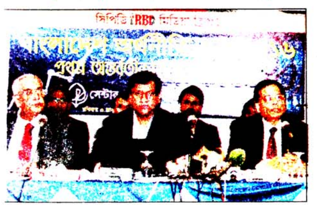
্রকাল রোববার ব্র্যাক সেন্টার মিলনায়তনে সিপিডির উদ্যোগে বাংলাদেশ মর্থনীতি ২০১৫-১৬ শীর্ষক মিডিয়া ব্রিফিং ও আলোচনা সভার আয়োজন করা হয়

স্টাষ্ণ রিপোর্টার : বেসরকারি গবেষণা সংস্থা সেন্টার ফর পলিসি ডায়ালগ (সিপিডি) মনে করে চলতি অর্থবছরে ৪০ হাজার কোটি টাকার রাজস্ব ঘাটতির সম্ভাবনা রয়েছে। মাত্রাতিরিক্ত লক্ষ্যমাত্রা নির্ধারণ, আমদানি পণ্যের দাম কম, সরকারি বিভিন্ন প্রণোদনা (ইনসেন্টিভ) ঘোষণায় রাজস্ব আদায় কম এবং ট্যাক্স আইনের বাস্তবায়ন না হওয়ায় এ রাজস্ব ঘাটতি হতে পারে।