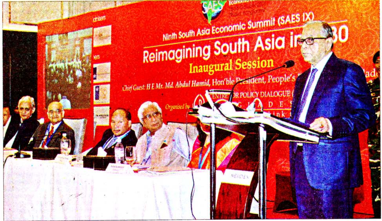
রাষ্ট্রপতি মো. আবদুল হামিদ গতকাল রাজধানীর স্থানীয় একটি হোটেলে ৯ম দক্ষিণ এশিয়া অর্থনৈতিক সম্মেলনে বক্তব্য প্রদান করেন