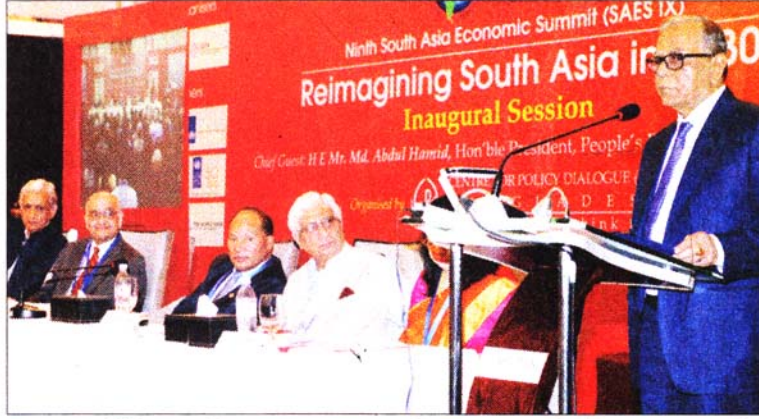
ঢাকার লা মেরিডিয়ান হোটেলে গতকাল সম্মেলনের উদ্বোধন করেন রাষ্ট্রপতি মো. আবদুল হামিদ

ঢাকার লা মেরিডিয়ান হোটেলে বেসরকারি গবেষণা সংস্থা সেন্টার ফর পলিসি ডায়ালগ (সিপিডি) দর্শনব্যাপী এ সম্মেলনের আয়োজন করেছে। দুপুরে দ্বিতীয় অধিবেশনে সম্মেলনের উদ্বোধন করেন রাষ্ট্রপতি মো. আবদুল হামিদ। দক্ষিণ এশিয়া অর্থনৈতিক সম্মেলন হচ্ছে আঞ্চলিক উন্নয়নে সংশ্লিষ্ট দেশগুলোর যৌথ করণীয় নির্ধারণে আলোচনা ও বিতর্কের একটি প্ল্যাটফর্ম। ২০০৮ সাল থেকে এই সম্মেলন হয়ে আসছে। প্রথমবার শ্রীলঙ্কাতে আয়োজন করা হয়েছিল এই সম্মেলন। বর্ষশেষ গত বছর ইসলামাবাদে অনুষ্ঠিত হয়। বাংলাদেশ, ভারত, শ্রীলঙ্কা, পাকিস্তান ও নেপালের পাঁচটি গবেষণা প্রতিষ্ঠানের যৌথ উদ্যোগে প্রতিবছর এই সম্মেলন অনুষ্ঠিত হয়ে আসছে। দক্ষিণ