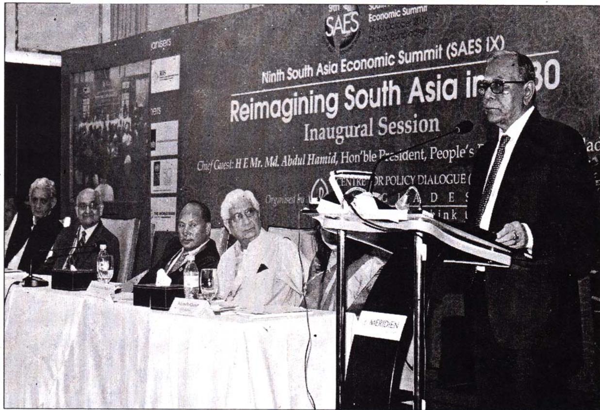
President Abdul Hamid addressing the Ninth South Asia Economic Summit, organised by Centre for Policy Dialogue (CPD) at Le Meridien Hotel in the city on Saturday.