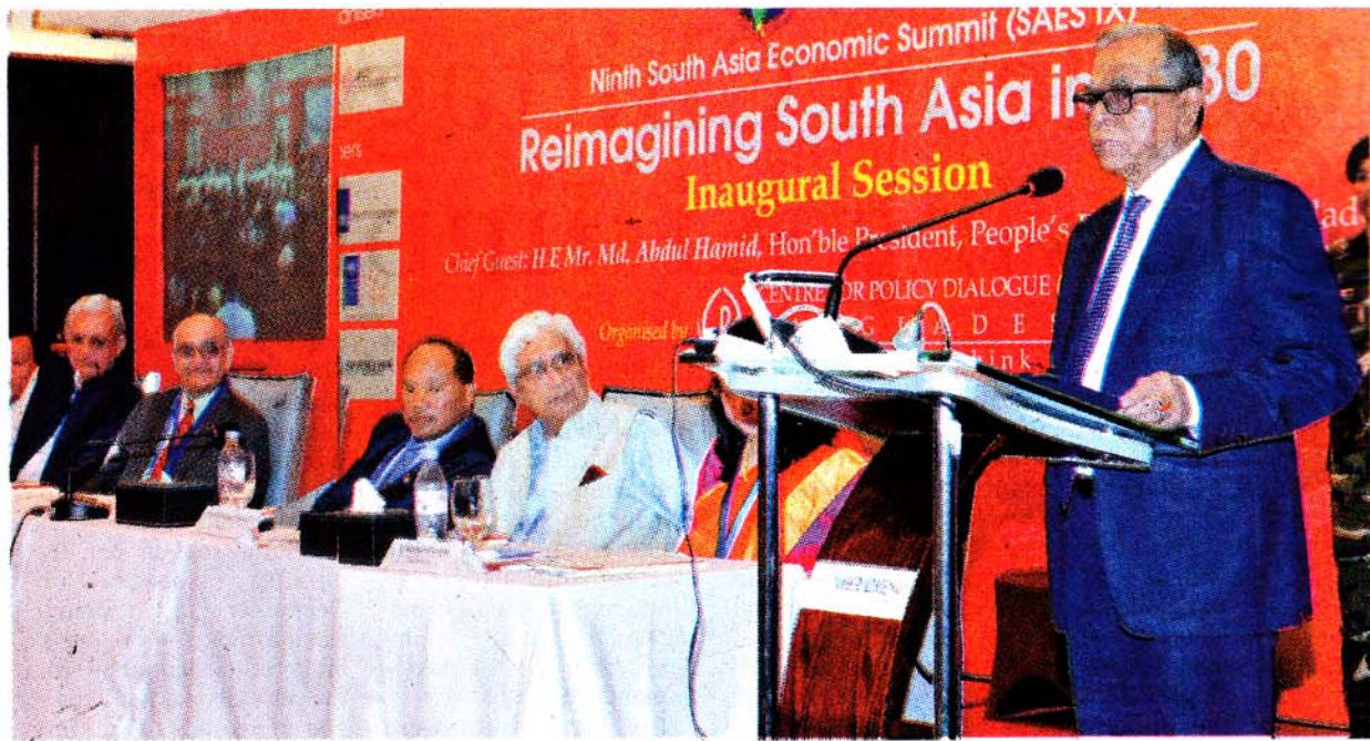
President Abdul Hamid delivering speech at the Ninth South Asia Economic Summit (SAES IX) organized by Centre for Policy Dialogue (CPD) at Le Meridien Hotel in the city on Saturday.