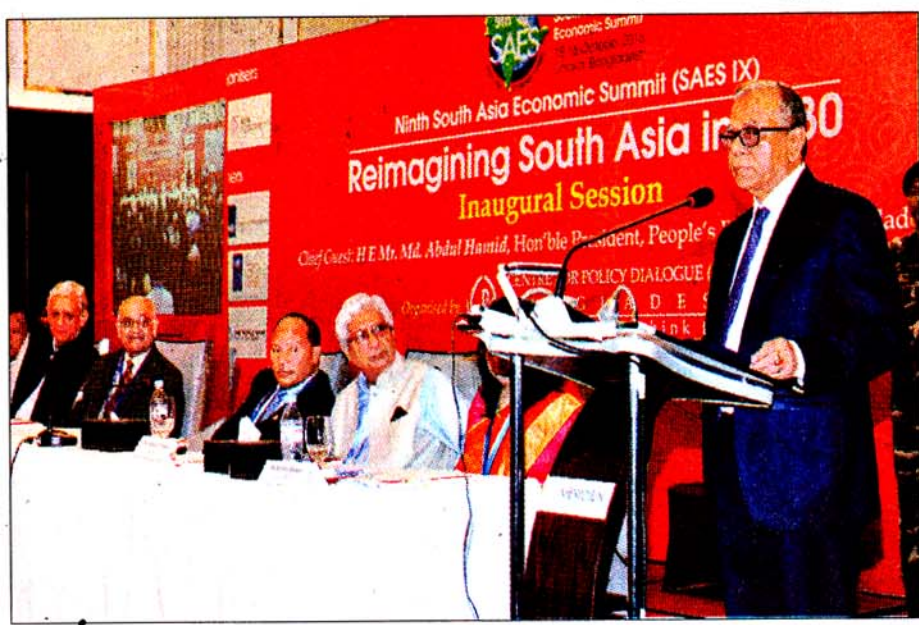
রাষ্ট্রপতি মোঃ আবদুল হামিদ হোটেল মেরিডিয়ানে নবম দক্ষিণ এশিয়া অর্থনৈতিক সম্মেলনে ভাষণ দেন

আমরা দৃঢ়ভাবে বিশ্বাস করি, আঞ্চলিক প্রতিবেশীদের সঙ্গে বিভিন্ন খাতে নিবিড় সহযোগিতা সরকারের এ লক্ষ্য পূরণে ভূমিকা রাখবে। এ সময় জাতিসংঘ ঘোষিত সহস্রাব্দের লক্ষ্য পূরণেও দক্ষিণ এশীয় দেশগুলোর একসঙ্গে কাজ করা দরকার বলেও মন্তব্য করেন রাষ্ট্রপতি। আবদুল হামিদ বলেন, আমরা এমন একটা দক্ষিণ (১৯ পৃষ্ঠা ৫ কঃ দেখুন)