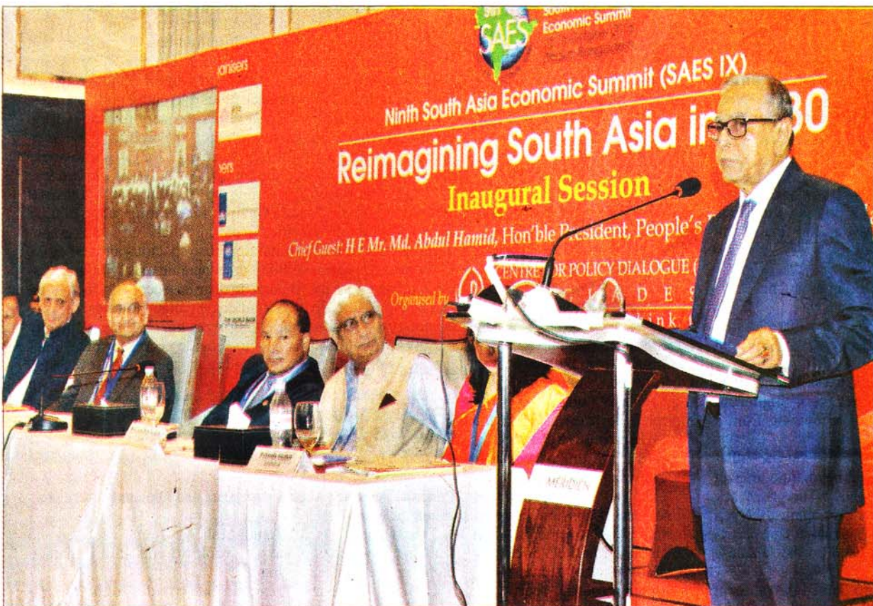
President Abdul Hamid addresses the Ninth South Asia Economic Summit at Hotel Le Meridien Dhaka in the city on Saturday.