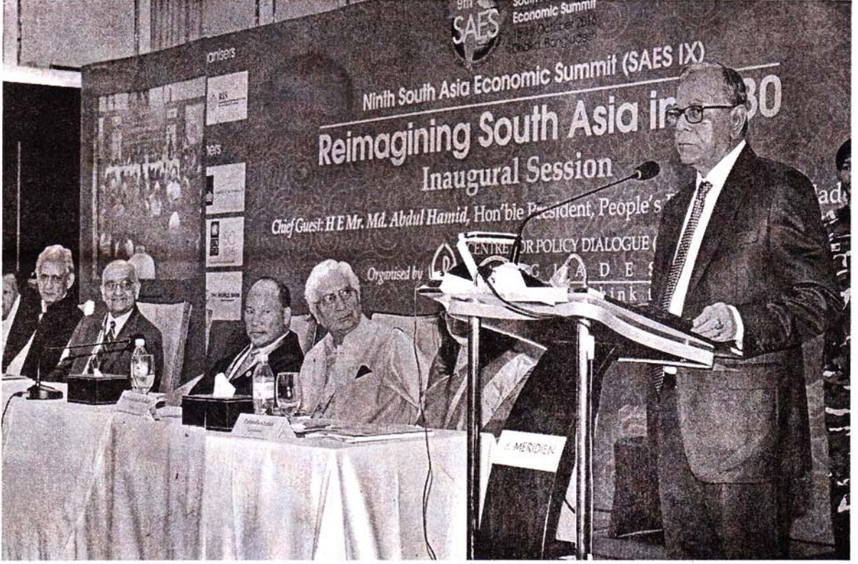
রাজধানীর হোটেল লা মেরিডিয়ানে গতকাল ৯ম দক্ষিণ এশিয়া অর্থনৈতিক সম্মেলনের উদ্বোধনী সেশনে বক্তব্য রাখেন রাষ্ট্রপতি মো. আবদুল হামিদ