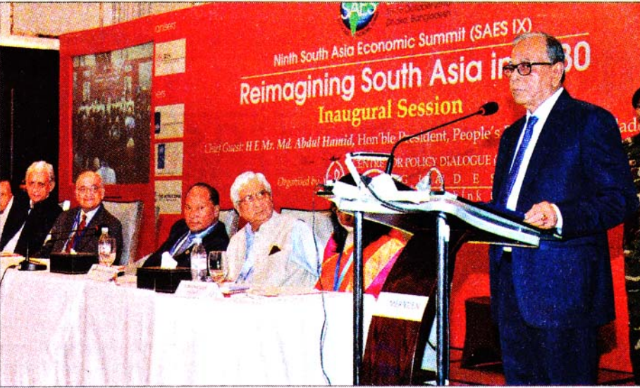
রাষ্ট্রপতি আবদুল হামিদ শনিবার রাজধানীর একটি হোটেলে নবম দক্ষিণ এশিয়া অর্থনৈতিক সম্মেলনে বক্তব্য রাখেন