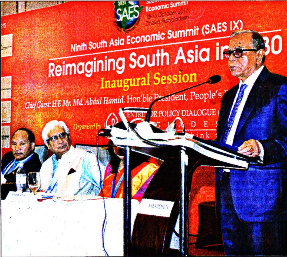
রাষ্ট্রপতি মো. আবদুল হামিদ গতকাল রাজধানীর স্থানীয় একটি হোটেলে ৯ম দক্ষিণ এশিয়া অর্থনৈতিক সম্মেলনে বক্তব্য প্রদান করেন