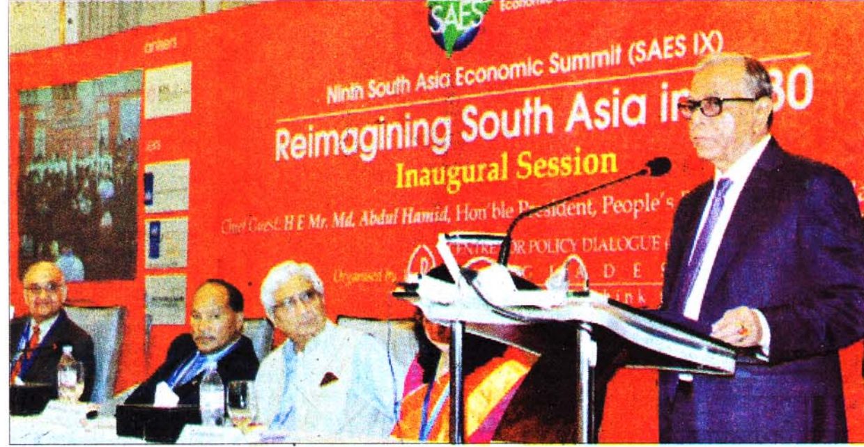
রাজধানীর একটি হোটেলে গতকাল বেসরকারি গবেষণা প্রতিষ্ঠান সেন্টার ফর পলিসি ডায়ালগ (সিপিডি) আয়োজিত নবম দক্ষিণ এশিয়া অর্থনৈতিক শীর্ষ সম্মেলনের উদ্বোধনী অনুষ্ঠানে বক্তব্য রাখেন রাষ্ট্রপতি মো. আবদুল হামিদ