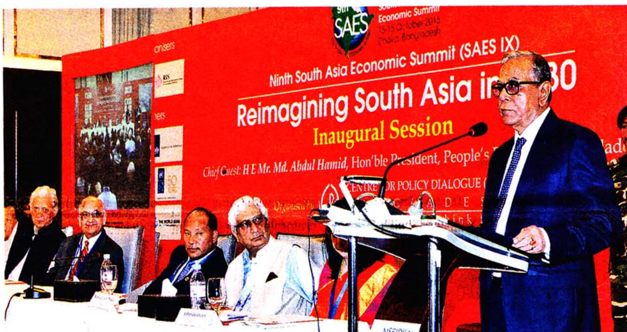
President Abdul Hamid addressing the inaugurating ceremony of Ninth South Asia Economic Summit (SAES IX) Organised by Centre for Policy Dialogue (CPD) at Le Meridien Hotel in the city on Saturday.