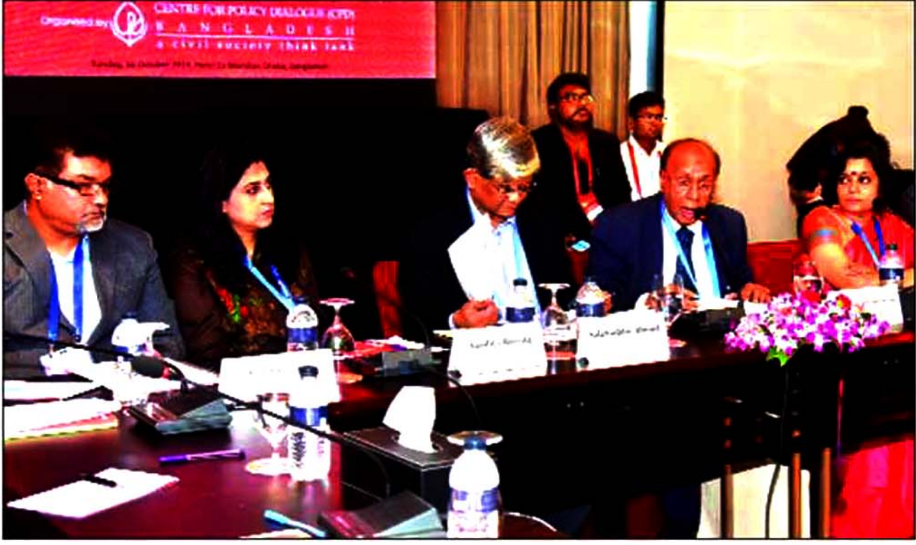
রাজধানীর হোটেল লা মেরিডিয়ানে রোববার সিপিডি আয়োজিত দক্ষিণ এশিয়া অর্থনৈতিক সম্মেলনের এক অধিবেশনে বক্তব্য রাখেন সাবেক তত্ত্বাবধায়ক সরকারের উপদেষ্টা মির্জা আজিজুল ইসলাম। এ সময় অন্যান্য অতিথি উপস্থিত ছিলেন।