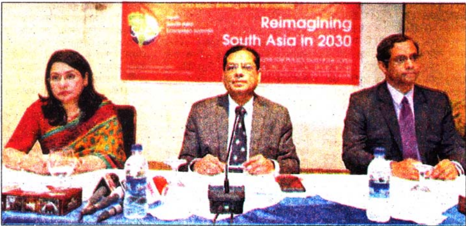
ব্র্যাক সেন্টারে সিপিডির সংবাদ সম্মেলন ■ নয়া দিগন্ত