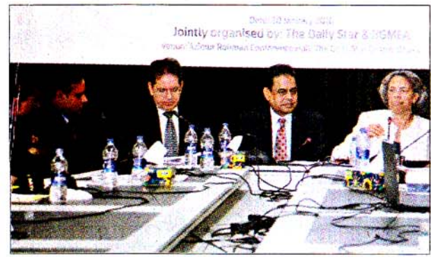
ডেইলি স্টার ও বিজিএমইএ আয়োজিত গোলটেবিল বৈঠকে অতিথিরা প্রথম আলো

২০২১ সালে ৫ হাজার কোটি বা ৫০ বিলিয়ন ডলারের তৈরি পোশাক রপ্তানির লক্ষ্য অর্জন নিয়ে গোলটেবিল আলোচনা