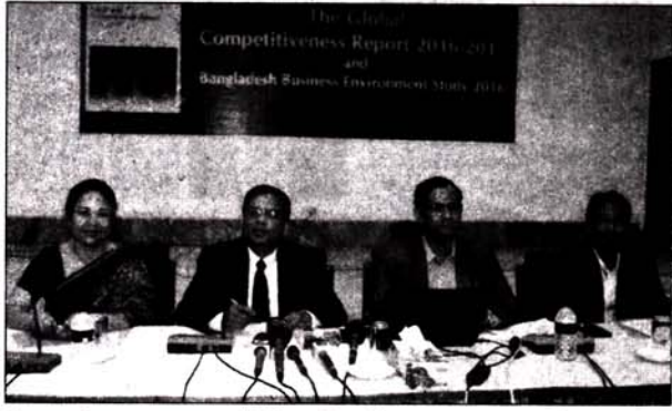
সিরডাপ মিলনায়তনে গতকাল বৈশ্বিক প্রতিযোগিতা সক্ষমতা সূচক প্রতিবেদন প্রকাশ উপলক্ষে সিপিডির অনুষ্ঠানে অতিথিরা ■ নয়া দিগন্ত